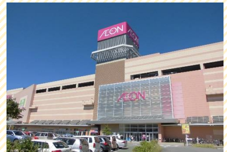
▶イオンモール福岡伊都店（徒歩1分）