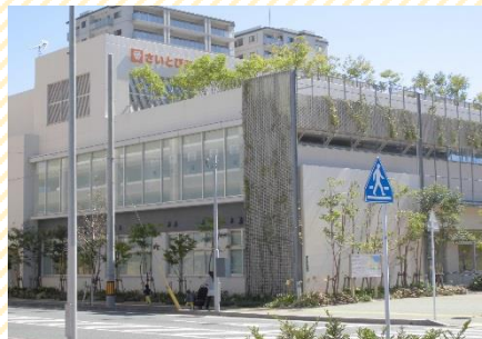
▶さいとぴあ（徒歩2分）