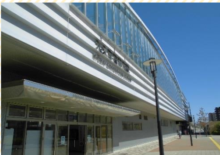
▶JR九大学研都市駅（徒歩3分）

地域複合福祉センターいと楽しは、JR九大学研都市駅から徒歩3分にあります。さいとぴあ（西区役所西部出張所、体育館、図書館等が入る公共施設）やイオンモール福岡伊都店もすぐ近くにあり、大変利便性も高く、さらに建物隣には大きな公園もあり、自然にも恵まれた大変よい住環境で、快適な生活が送れます。子どもから高齢者の多世代交流福祉施設として、地域の皆さまに、元気と笑顔をお届けしています。